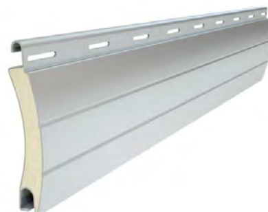
PA 55 wysokość profilu: 55mm grubość: 14mm