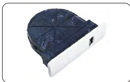
Podtynkowy zwijacz na taśmę