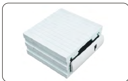
Podtynkowy zwijacz na taśmę z ociepleniem