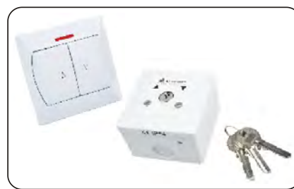
Przełączniki klawiszowe i kluczykowe