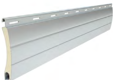
PA 45 wysokość profilu: 45mm grubość: 9mm